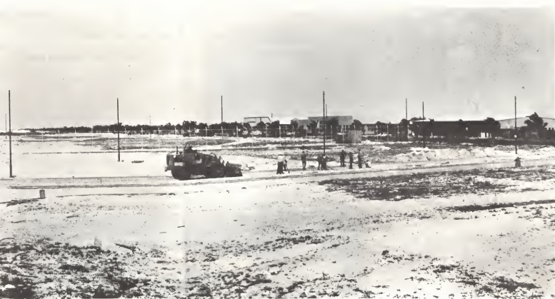
ergo di Arubaanse Wegenbouw.